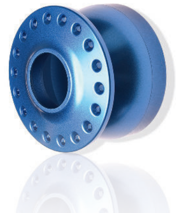
Bauteil mit blau eingefärbter NUCOCOMP®-Schicht.

Legierung 6061 T6, anodisiert (MIL Typ III) 10 µm / hartanodisiert (MIL Typ III) 37,5 µm / NUCOCOMP® 10 µm / NUCOCOMP®-H 37,5 µm.